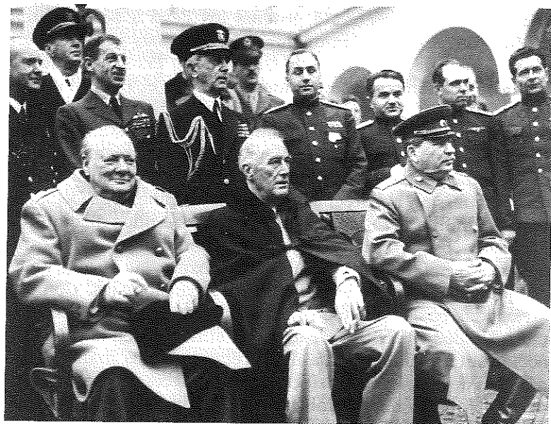
ILUSTRACIÓN VII.1. Churchill, Roosevelt y Stalin en Yalta, febrero de 1945

tánica (posteriormente se incluyó una francesa), en tanto que Berlín (que quedaba en medio de la zona rusa) también se dividiría en las zonas correspondientes. En Austria se aplicaría un arreglo de las mismas características.